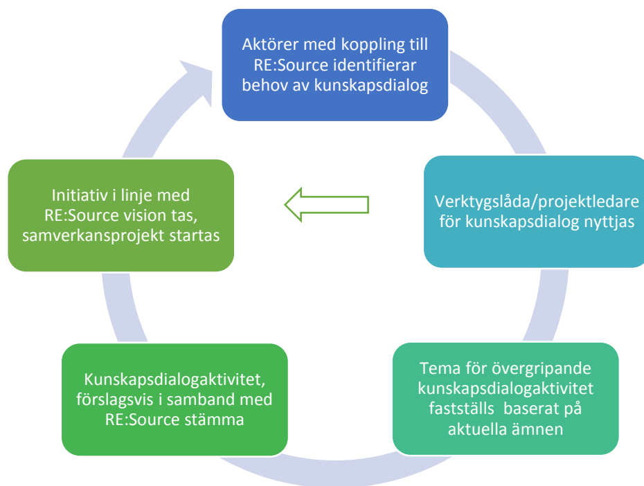
Figur 1: Underlag till arbetsmodell för kunskapsdialog anpassad för RE:Source

RE:Source behöver en infrastruktur som svarar på behoven och baseras på identifierade framgångsfaktorer. Figuren nedan visar hur en sådan infrastruktur kan vara uppbyggd kring hjälpmedel och aktiviteter för att stimulera samverkan och kunskapsutbyte, det som inom projektet kallas för kunskapsdialog. Nästa steg är att sammanställa en verktygslåda för kunskapsdialog för att därefter testa, utvärdera och vidareutveckla modellen i syfte att stötta enskilda organisationer och stimulera en levande kultur för kunskapsdialog inom programmet.